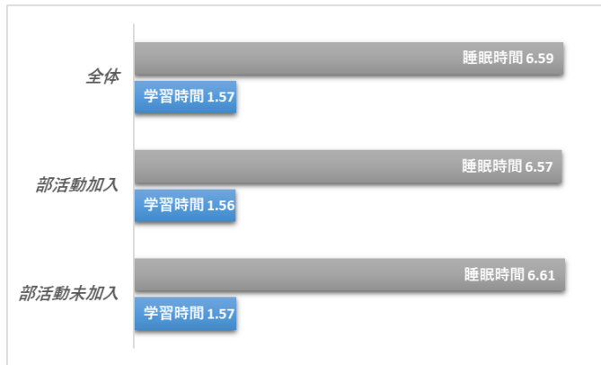
資料1 部活動加入と睡眠時間・学習時間の比較