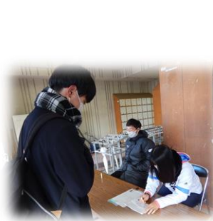
↑体温・体調チェック

一人一人が意識を高め、対策を行っていくことが大切です。御協力よろしく願い致します。