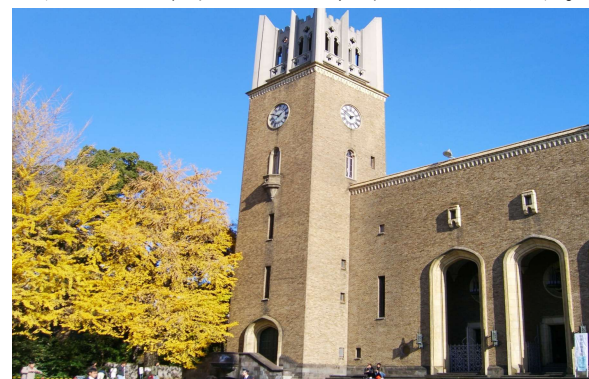
早稲田のシンボル大隈講堂

何よりも印象的なのは、学生の活気です。コロナが収束しつつあるこの頃、早慶戦や早稲田祭、ラグビー早明戦などの行事を通じて「早稲田人」としての自覚が芽生えていくのでしょうか。キャンパスを歩いていると、早稲田の校歌の「都の西北」が聞こえてきました。「学内だけでなく、社会のあらゆる分野に早稲田のOBOGがいてくれるので、それも早稲田の財産です。」という学生の言葉が早稲田の強みを物語っています。