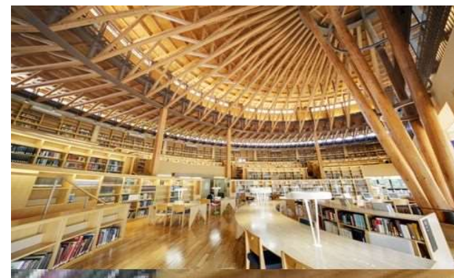
365日24時間オープン図書館

国際教養大学は、総合型推薦入試や学校推薦型入試をはじめ、様々な入試制度がありますが、一般入試にも特色があります。他の国公立大と個別学力試験（二次試験）の日程がかわらないので、併願ができ、A～C日程とチャンスが3回もあります。おまけに個別試験（二次試験）は東京の会場（秋葉原）で受験できます。