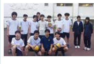
男子バレーボール同好会