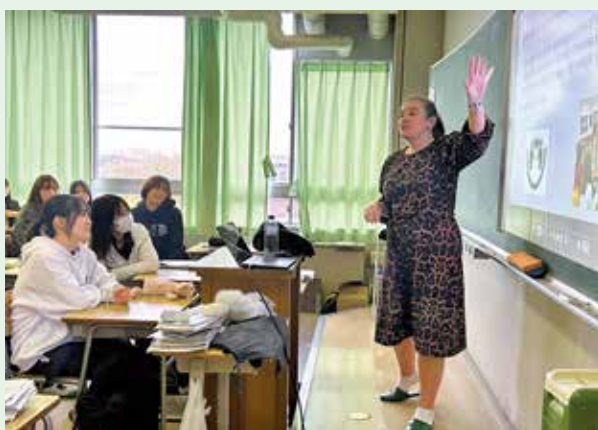
プリマス・カレッジ出前授業

外国で活躍されている方や国際関係の仕事をしている方による国際理解講演会は、社会課題に対する関心を深めグローバルな視野を広げる機会となっています。令和7年度はミャンマーとつなぎ、現地の厳しい状況や海外での経験、価値観などについて聴講し、平和や安全、自分たちの国について改めて考える契機となりました。