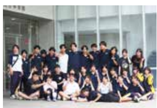
女子ハンドボール部