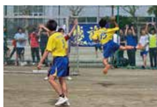
男子ハンドボール部