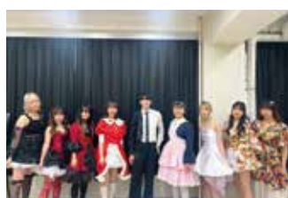
ファッションクリエイト部