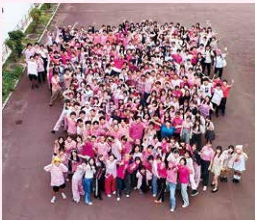
学友会主催イベント “ピンクシャツデー”

本校では、生徒会のことを学友会と呼んでいます。学友会の執行機関として、会長、副会長、会計・文化・運動の各委員長が毎年、前期・後期に公選されています。代議機関としての中央協議会（中協）は、各クラス代表（級長）と委員長で構成され、自治的活動を行っています。