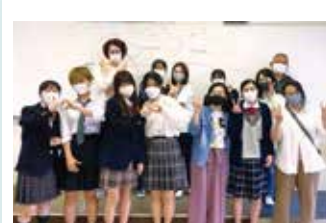
E S S