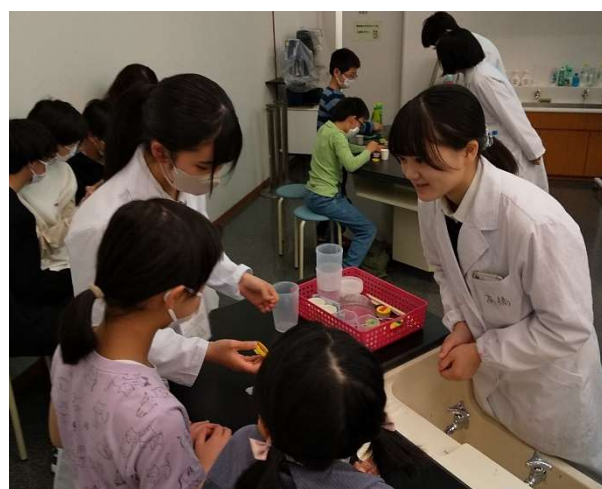
人工イクラの実験

SSH 物理では「ガウス加速器の実験」とアルミ箔とおはじきを使った「浮力の実験」をしました。浮力の実験では同じ大きさのアルミ箔を使って、誰がたかさんのおはじきをのせても沈まないかを競争しました。SSH 化学では「人工イクラ」と「スライム」を作製しました。自分で材料を混ぜ合わせて、化学反応により物が出来上がる喜びを実感できたと思います。このような科学実験教室で体験だけでなくなぜそうなるかの原理も理解しました。今後も科学に興味を持ってもらえると嬉しいです。