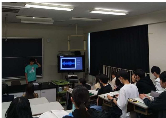
口頭発表および議論