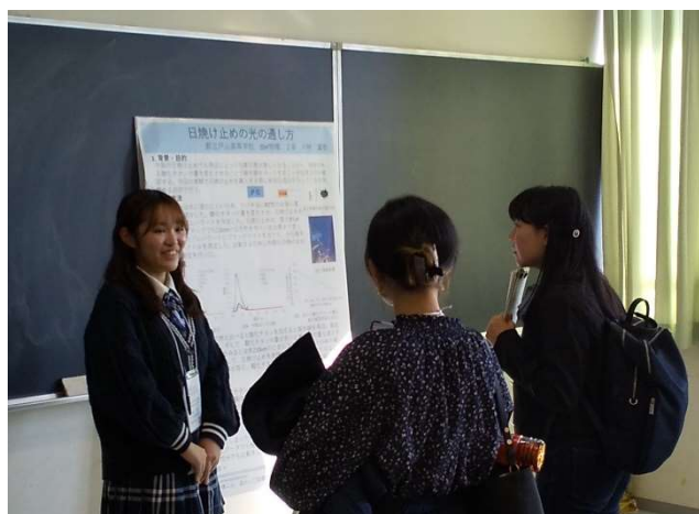
ポスター発表セッション