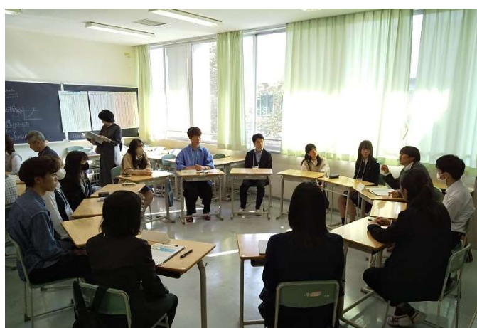
キャリアラウンドテーブルセッション