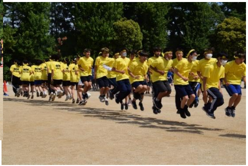
1年大縄跳び↑ ←2年ムカデ 用具↓