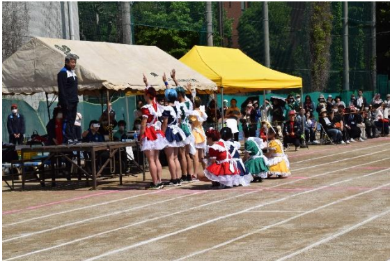
団長団パフォーマンスと選手宣誓