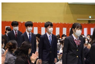
↑ 新入生入場・入学許可 ↓