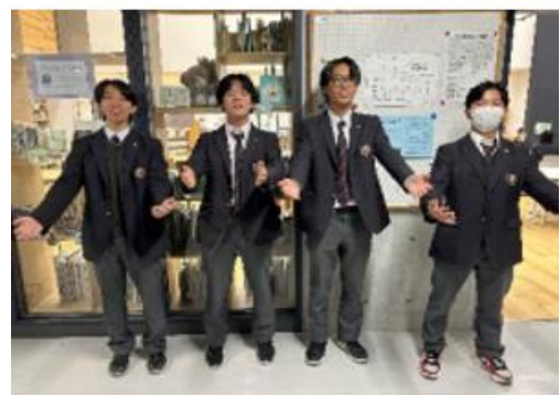
👉 写真2：学校説明会の様子