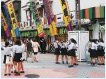
△ 芸術鑑賞教室 ▽