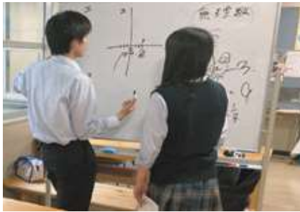
◀自習コーナーの様子