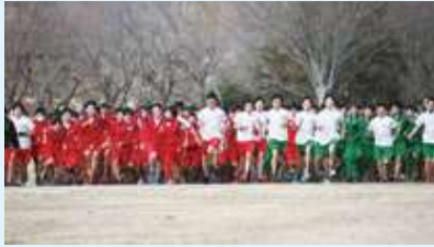
△ロードレース大会（持久走大会）