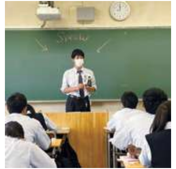
△英語授業（プレゼンテーション「自分のお気に入り」）