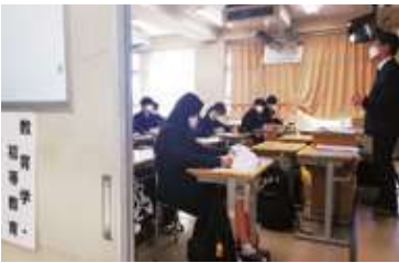
△大学・専門学校の担当者が招いた進路説明会の様子