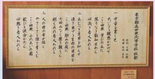
PTAの寄贈による「校歌額」設置