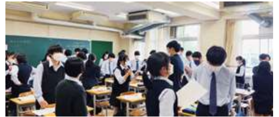
△英語授業（ペアワーク）