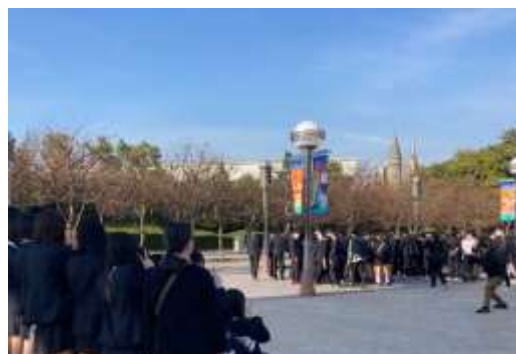
集合写真を撮ります。