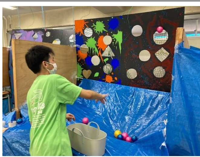
3年4組 ミニゲーム ボールを穴に入れる！結構難しい。