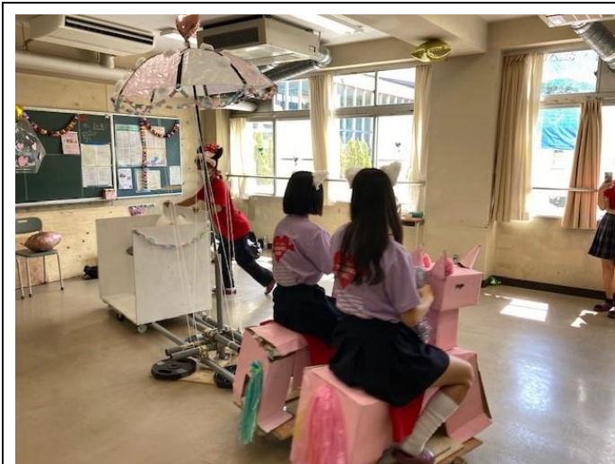
3年3組 メリーゴーランド。なんと4人乗り！