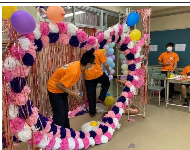
3年6組 人探しとフォトスポット。和やかな雰囲気。