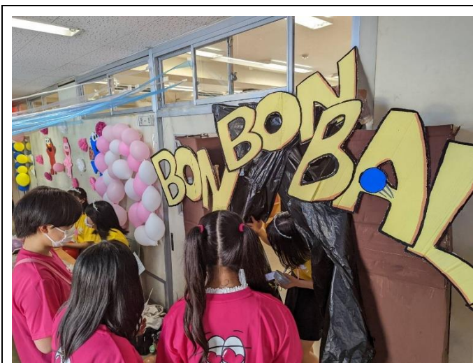
3年5組 ボールゲーム 来場者への言葉かけがよかった。