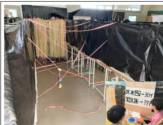
3年7組 脱出ゲーム。謎がむずかしい！