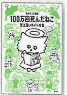
由柄高校所蔵あり 015/フ

皆さんは、図書館でレファレンスを利用したことがありますか?この資料が欲しい、調べたいことがあるけれど何をしたらいいかわからない、という時に図書館が強い味方になってくれます。そんなレファレンスの事例を集めた本が、『100万回死んだねこ 覚え違いタイトル集』です。言わずもがな、『100万回生きたねこ』をお探しの利用者に、無事正確な本が届けられてレファレンスは完了となります。タイトルから遠く離れば離れるほど、図書館の腕の見せどころ!