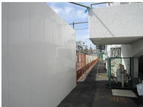
(校舎西側 道路側から)