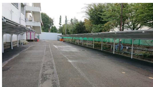
(校舎西側 校庭側から)