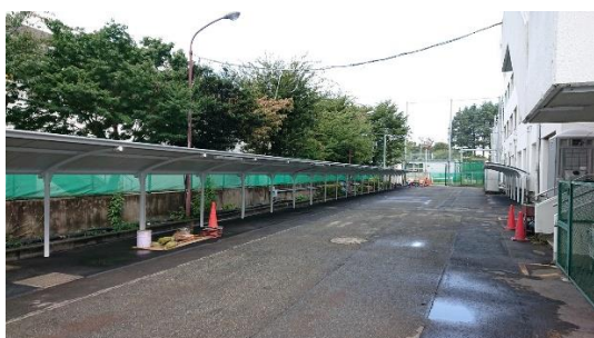
(校舎西側 道路側から)