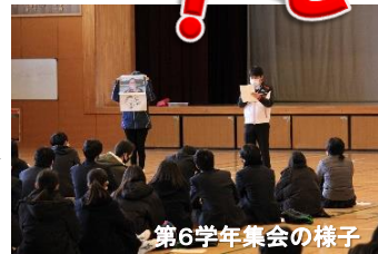
第6学年集会の様子

6学年の学年集会がありました。共通テスト直前の「受験説明会」の集会です。校長からの励ましの言葉の後、進路指導主任から、受験日当日の注意点や心構え等の話がありました。「もしも…」の時にも慌てないで行動するように…と細かな話がありました。その後、第6学年の担任・副担任から「蓄えた力をすべて出し切って」「いつもの通りで大丈夫」などの励ましの言葉がありました。「よしっ、頑張るぞ!」とやる気いっぱい力強い表情で、その日6年生は下校していきました。そして迎えた「大学入学共通テスト」の日。1月15日(土)の第1日目は「社会(地理歴史・公民)」「国語」「英語」、翌日16日(日)は「理科①②」「数学①②」のテストに臨みました。この共通テストを第1のターゲットの日として、学習を続けてきた第6学年の生徒たち。蓄えてきたすべての力を出し切って、2日間の共通テストに挑戦しました。17日(月)には、学校に登校して、共通テストの自己採点を行い、2月下旬の国公立大学2次試験に備えて準備を始めました。第6学年の生徒たちの夢に向かう戦いはまだまだ続きます。頑張れ!第6学年の生徒たち。未来の自分に近づくため…。