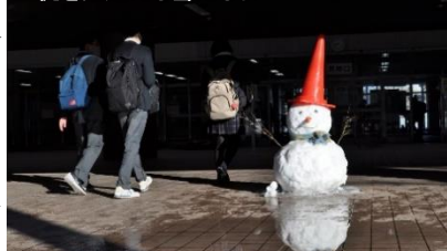
生徒をお出迎える雪だるま

始業式後は各学年の集会が行われ、「1年のまとめとなる3学期、次の学年の0学期」という話があり、改めて気を引き締めた生徒もいたようです。1月に入り、新型コロナウイルス感染症の感染者の数が増え始め、始業式の翌週に予定されていた「合唱祭」(2月中旬実施予定)のクラスの合唱練習を見合わせるようになりました。今まで通り感染予防対策を続けて、学校生活を継続していく立川国際です。