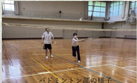
バドミントン部の様子