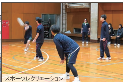
スポーツレクリエーション