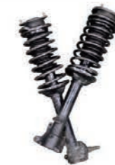
～Car maintenance～ 自動車整備