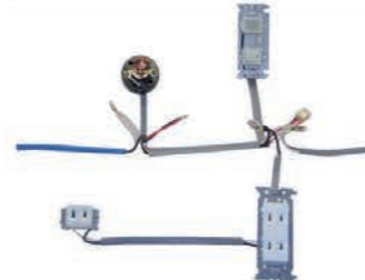
～Electric wiring～ 電気配線