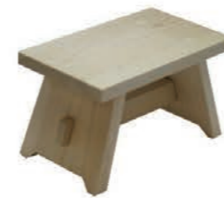
～Wood working～ 木工