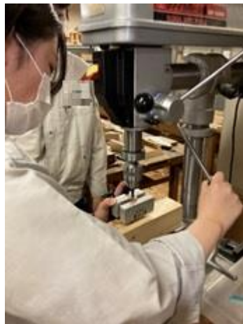
ペン軸を通すために、まっすぐに穴をドリルで開けます。