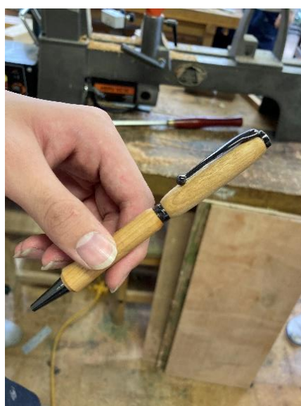
樺(かば)の木で作ったペン