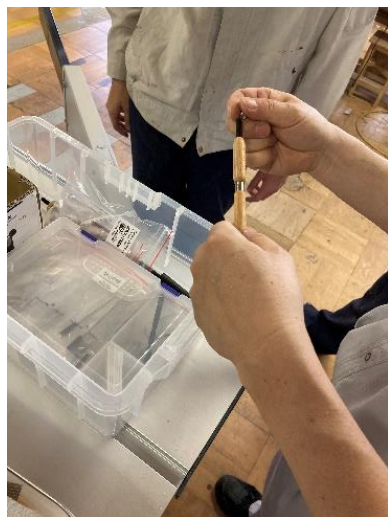
完成。デザインがイマイチ？