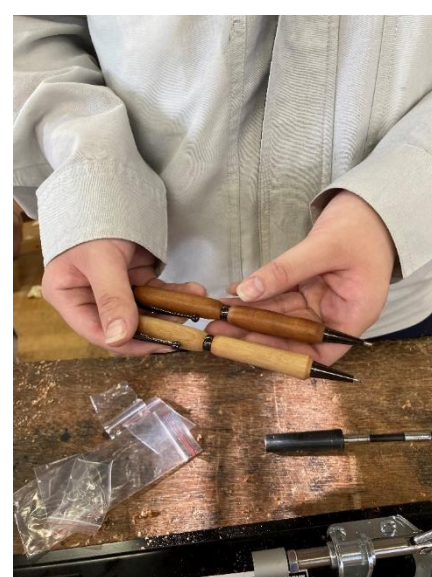
奥の赤いペンが桜の木