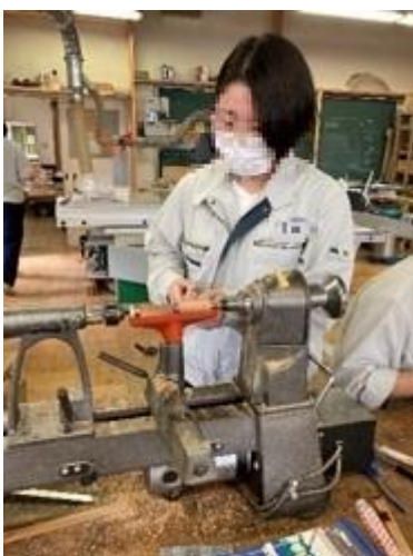
四角い木を旋盤で形を考え丸くします。