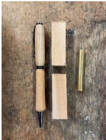
完成品と使用する木材

木工旋盤の使用方法を学んで、木のボールペンをつくります。 広葉樹の種類を知り、木工旋盤を使ってつくります。 記念に、一人1本を自分でつくる予定です。