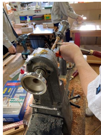
削るための刃の当て方が難しい。