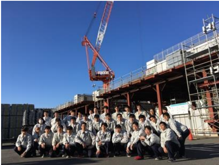
タワークレーンの前に集合

経験豊かなプロの現場監督の方々から、安全帯の使い方・ぶら下がり体験、作業台の点検、分電盤・電動工具取り扱い、平床台車の特性、タワークレーンを用いたウエイト落下試験、危険予知についてのお話などを、聞き、実際に体験することで、安全について学ぶことができました。