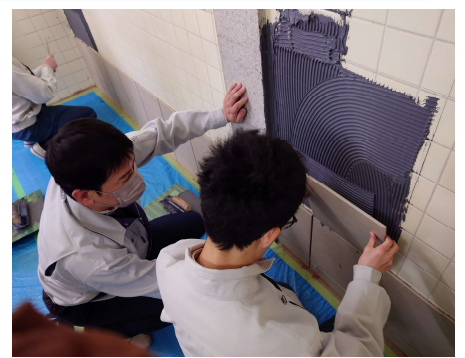
↑かなり貼り進んだところ。1枚1枚丁寧に組み合わせることで美しくなることがわかりました。