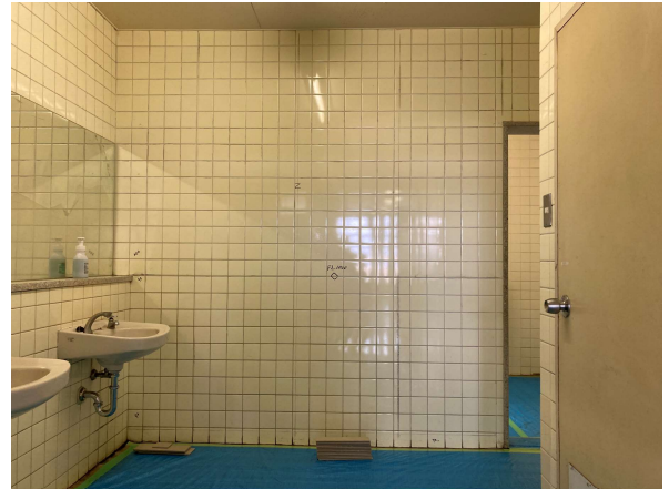
授業開始前の壁面