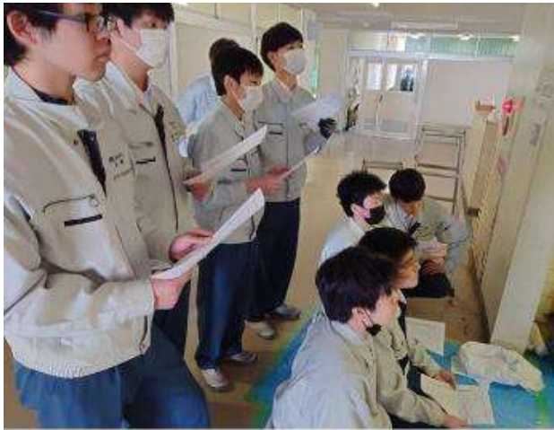
↑墨を出す大切さを学びました。

1年生工業技術基礎の授業に、日本陶業様のご協力があり、プロの先生方から指導を受けることができました。生徒たちは、以前に、3年生が日本陶業様よりご指導を受けた際に、タイルの仕事についてお話を伺いました。今回は、実際に、自分たちも校舎内トイレ壁面に貼る体験をしました。専用の接着剤のことや、タイルを切ることなど、体験してみないとわからないことがたくさんありました。ご指導ありがとうございました。