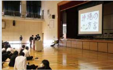
総合的な探求発表会