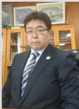
東京都立墨田川高等学校 校長