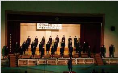
墨田川コンクール