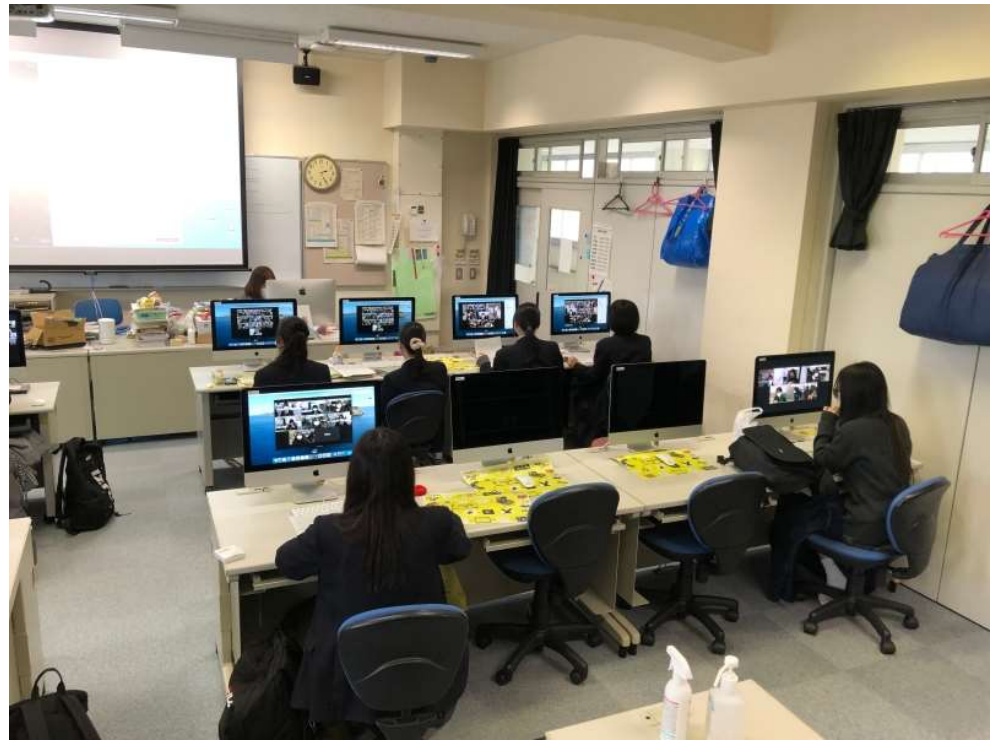
새해 복 많이 받으세요.