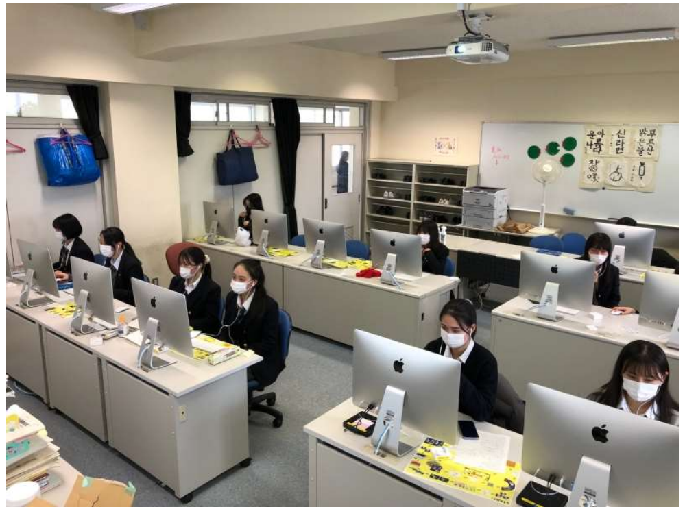
즐거운 크리스마스 뜻깊은 새해가 되길 바랍니다.