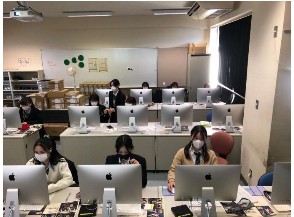
묵묵히 접속 준비를 하다

こういった韓国語の質問に本校の生徒が韓国語で答えるタスクでこちらが終わると예림디자인고등학교의生徒が答えます。