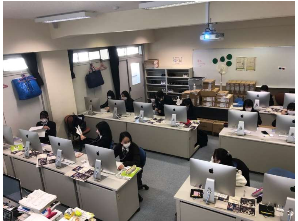
잠시 연습해 들까

11月3日は文化の日（祝日）でしたから授業はありませんでした。5時限目の最初5分程度でスライド回してイメージ作りを図りました