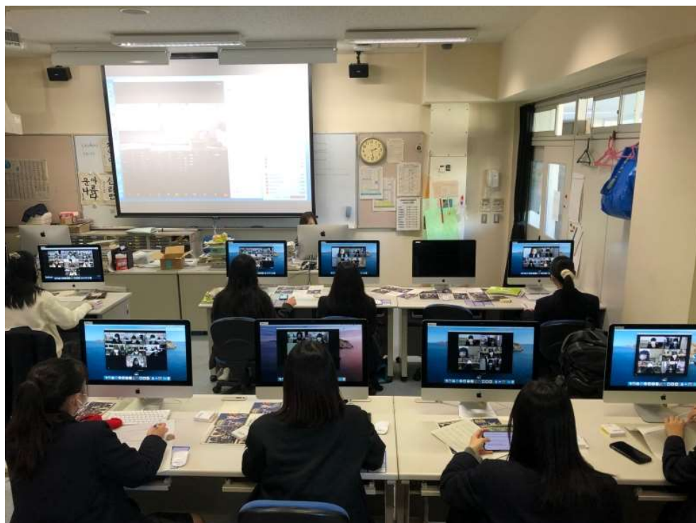
처음에는 조금 긴장