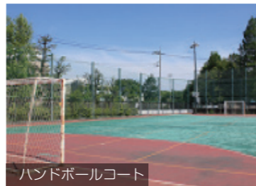
ハンドボールコート