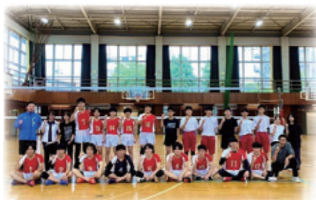
☆男子バレーボール部