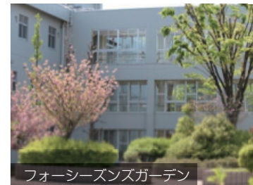
フォーシーズンズガーデン