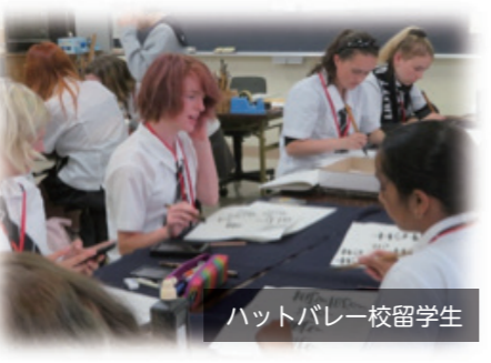
ハットバレー校留学生