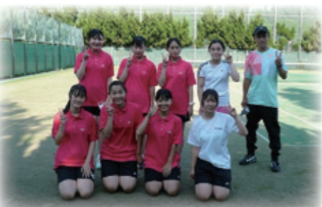
☆女子硬式テニス部