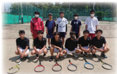
☆男子硬式テニス部