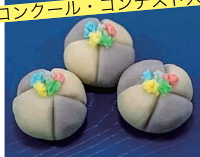
世田谷スイーツ&ブレッドコンテスト 和菓子部門銀賞