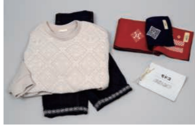
全国高校生クリエイティブ コンテスト優秀賞