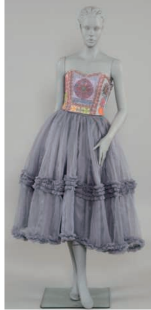
全国高校生クリエイティブ コンテスト優秀賞