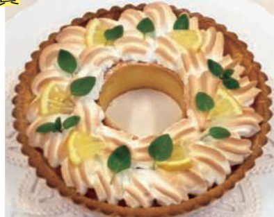
東日本高校生レシピコンテスト トレンドレシピ賞