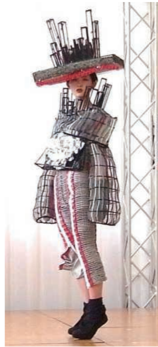
秋田さんフェア 高校生デザインコンテスト 優秀賞