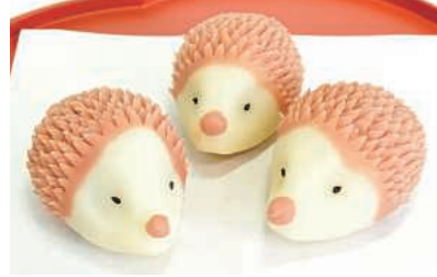
世田谷スイーツ&ブレッドコンテスト 和菓子部門金賞