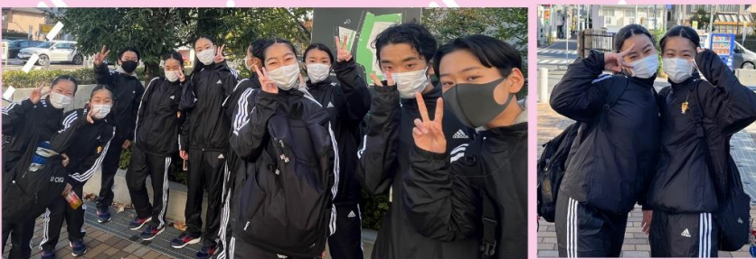
↑ ↓ 2年生を待つ1年生たち。2日目の余裕を感じます。