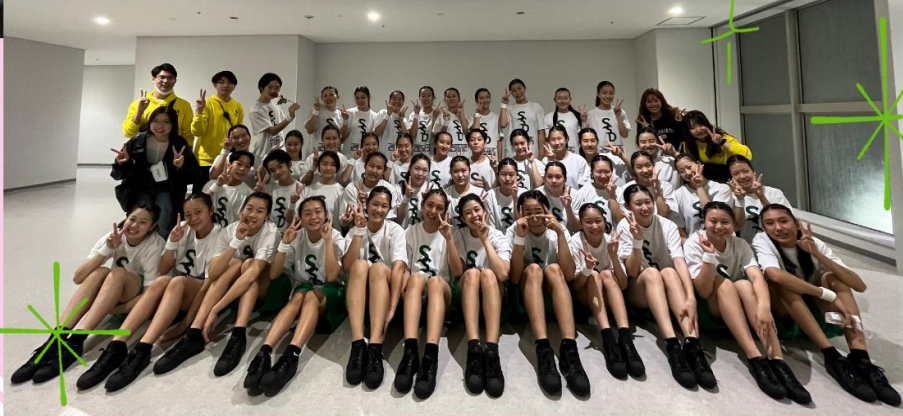
↑ → 2日間、素敵なステージをありがとうございました！ スタッフの大学生ともパシヤリ。