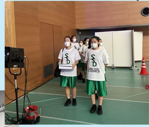
↑ ↓ 会場入りしたらすぐに場当たり。念入りに念入りに。