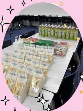
←ケータリング!! お菓子は奪い合いです…。