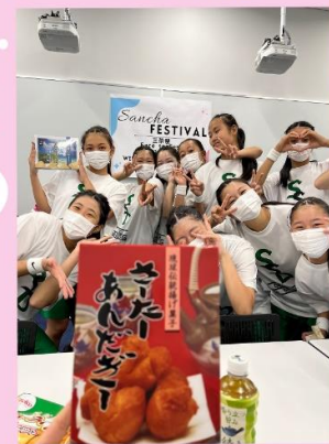
→ 2年生から沖縄土産をもらいました。楽しい思い出が作れたようですねにより。