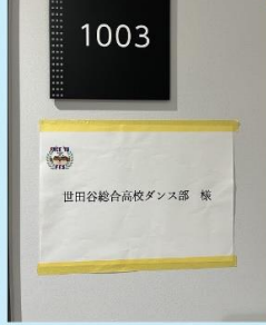
← 楽屋です。 芸能人みたい!