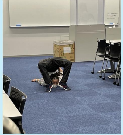
← 控室で最終調整。柔軟のエアース、流石です。