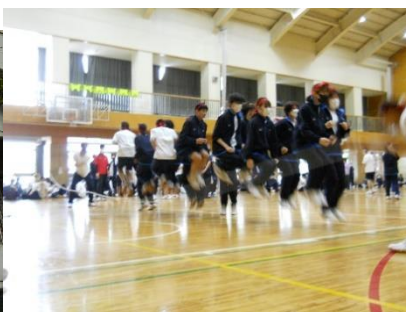
体育館へ移動して「大縄跳び」 リモート中継で校内配信