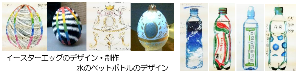
イースターエッグのデザイン・制作 水のペットボトルのデザイン