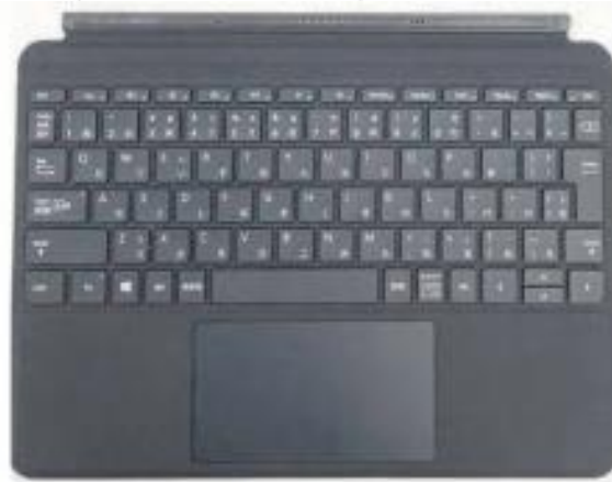
キーボードカバー