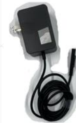
ACアダプター (電源コード)