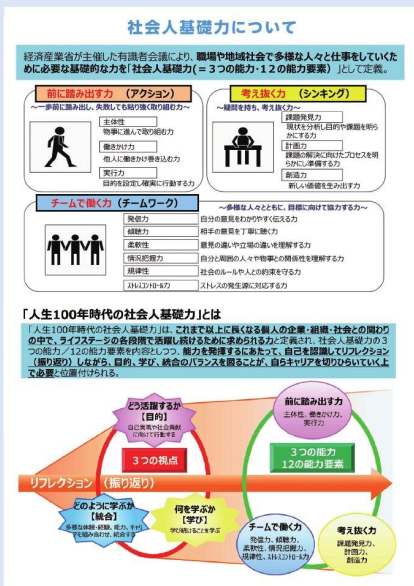
経済産業省ホームページ「人生100年時代の社会人基礎力」 https://www.meti.go.jp/policy/kisouyoku/