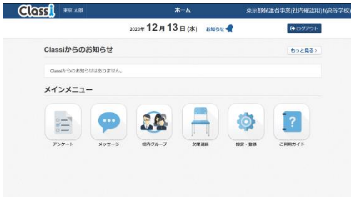
▲Classi東京都版 保護者画面 (PCブラウザ)

保護者の方： ネットワーク環境及び端末問わず、 ご自分のPC、スマートフォン、タブレット端末で、ご利用 いただくことができます