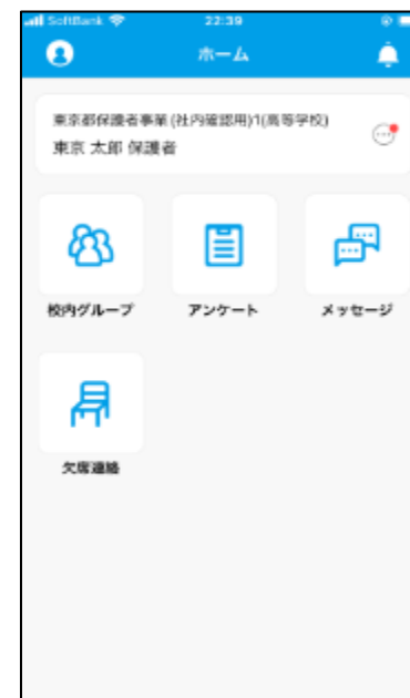
▲Classi東京都版 保護者画面 (アプリ)