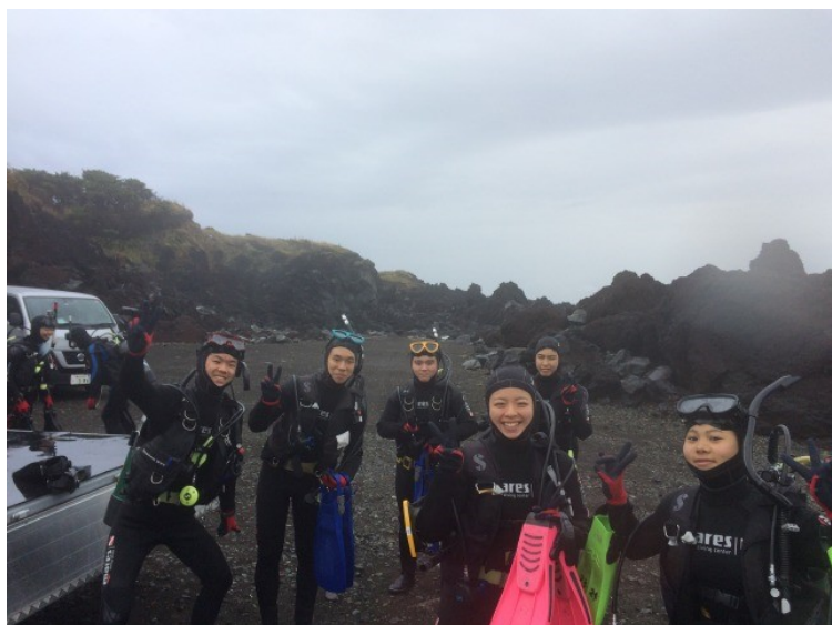
久しぶりのダイビング！曇っていましたが水はきれいでした

本日は、トウシキ沖へ2年生のみで、潜ってきました。近くのダイビングショップさんのお話によると、「ハンマーが回ってきてるよ」とのことでしたので、生徒達のテンションも上がります！