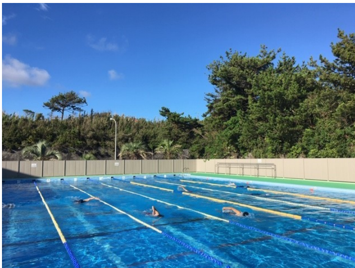
選挙後は久しぶりのプール練習