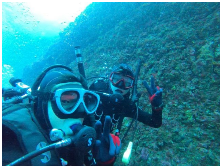
部長が持参したGOなんとかで撮った写真。きれいです