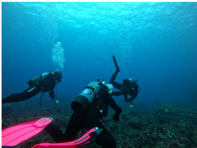
ハンマーには残念ながら遭遇しませんでした・・・。