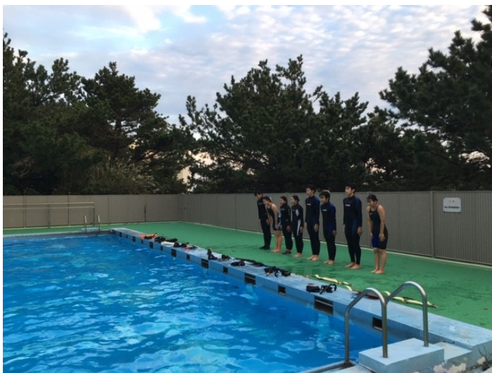
プールへ礼して、今年度のプール練習終了