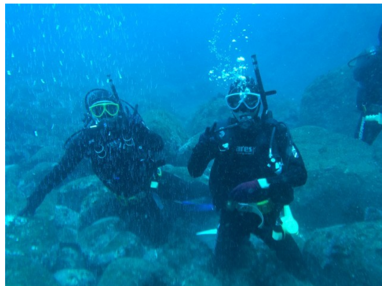
ハンマーは見れませんでした、楽しんでいました