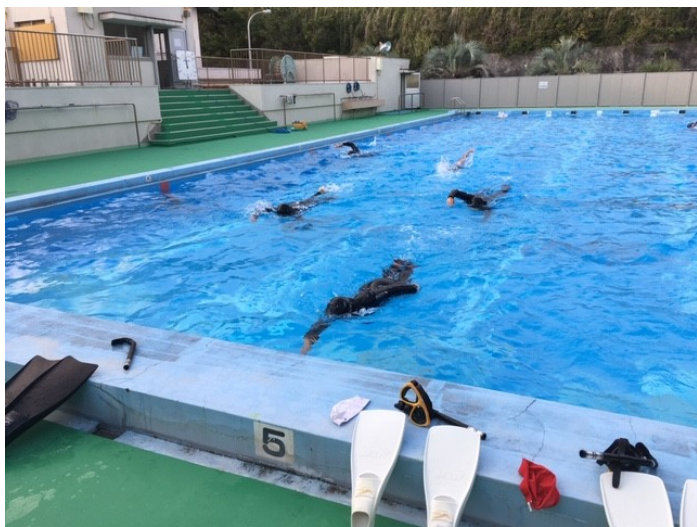
日没時刻も早くなり、部活動の時間で日が陰っています

今年度、本校プールでの最後の練習となりました。水温が低いなか、短時間フリッパー練習を行いました。これからは、陸上トレーニングと大島町立第一中学校プール等での練習が中心となります。