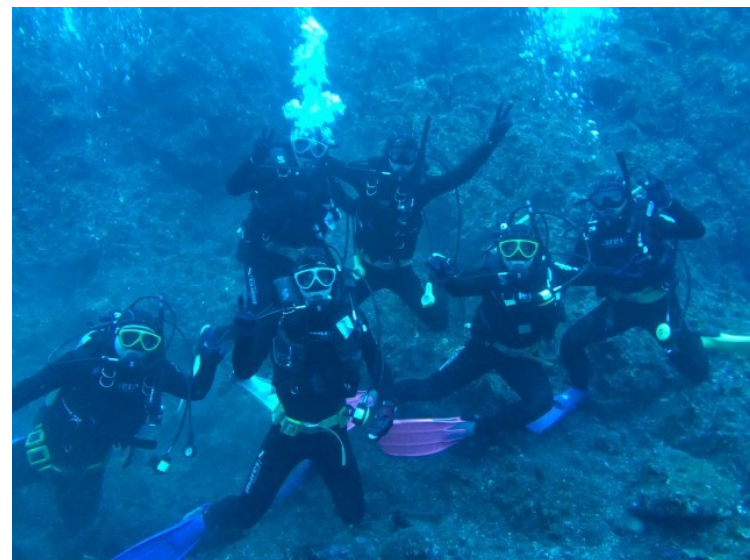
1名乗船中の女子部員の分も潜りました！