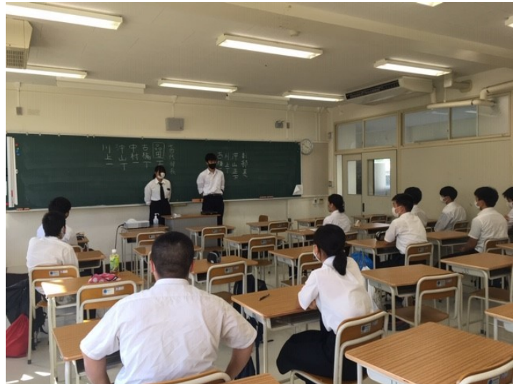
新部長・副部長より挨拶