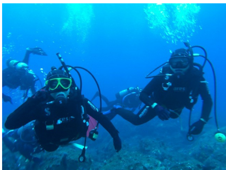
女子部員はウミガメを見れてラッキーでした！