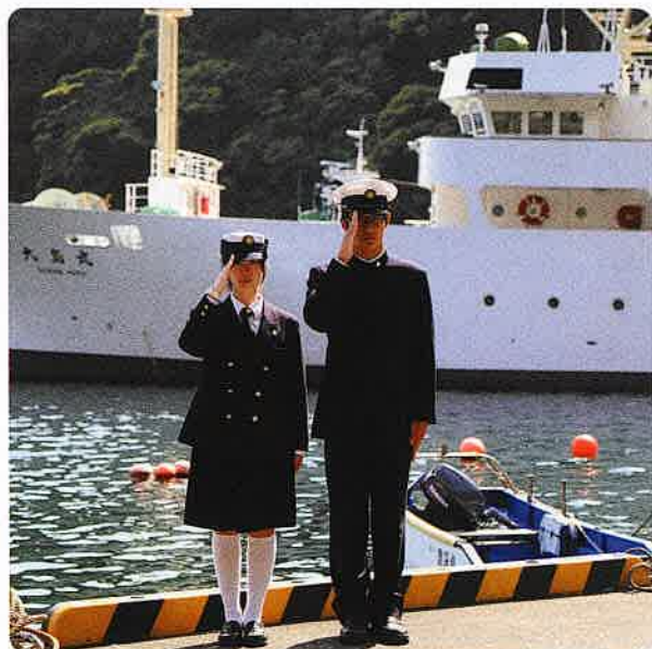
制服の正装 (制帽と白靴下)