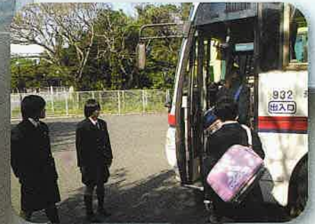
■ 登校(スクールバス)