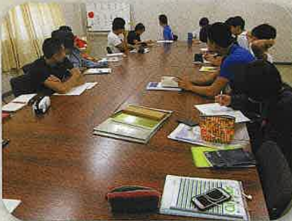
■ プリーフェクト制