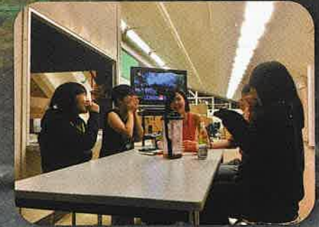
■ 消灯前の自由時間