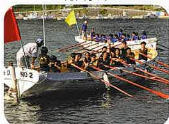
9月カッターレース