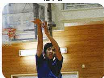
男子バスケットボール部