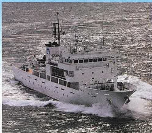
大型実習船 第5代大島丸 (令和2年度就航)