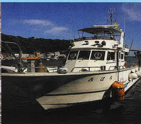
小型実習船 (みはら・りゅうおう2) は 3年時小型船舶実技で使用します。