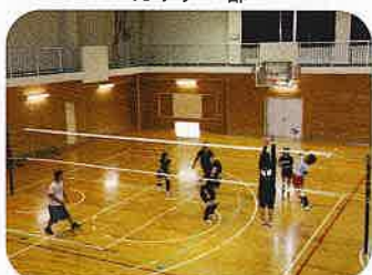
女子バレーボール部