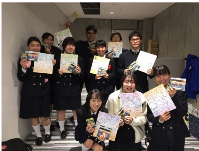
後輩達からは、色紙とドロップを送られました。