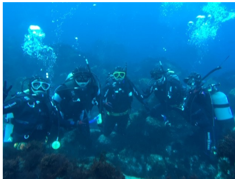
次回は2年生フルメンバーで潜りましょう！！