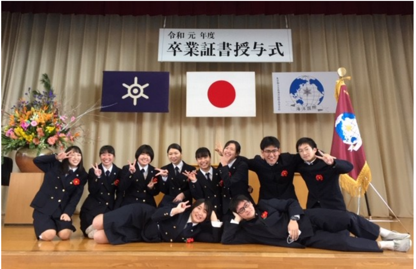
潜水部12期生諸君 卒業おめでとう！！

例年とは大きく異なる卒業式となってしまいましたが、12期生部員全員が元気に旅立ってくれたことを嬉しく思います。