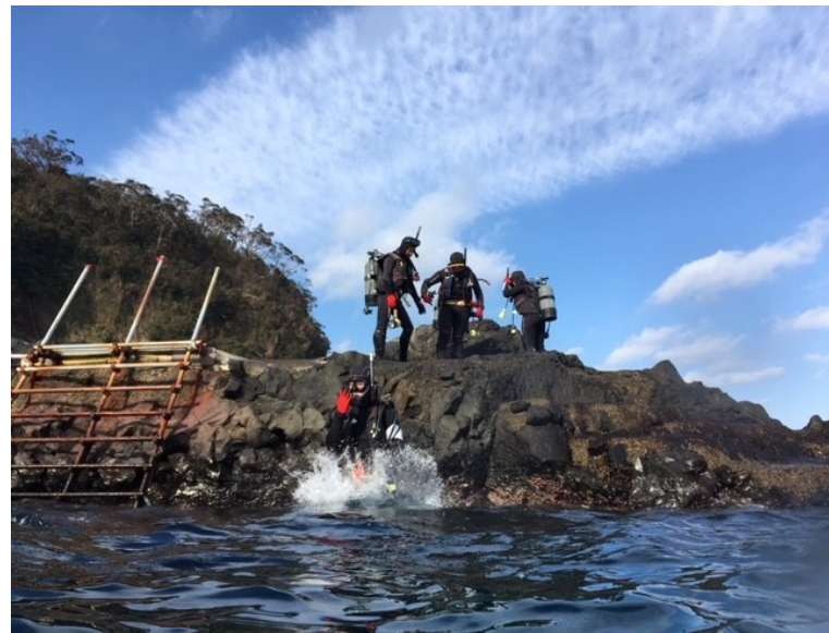
ボディチェックして、いざ海の中へ！