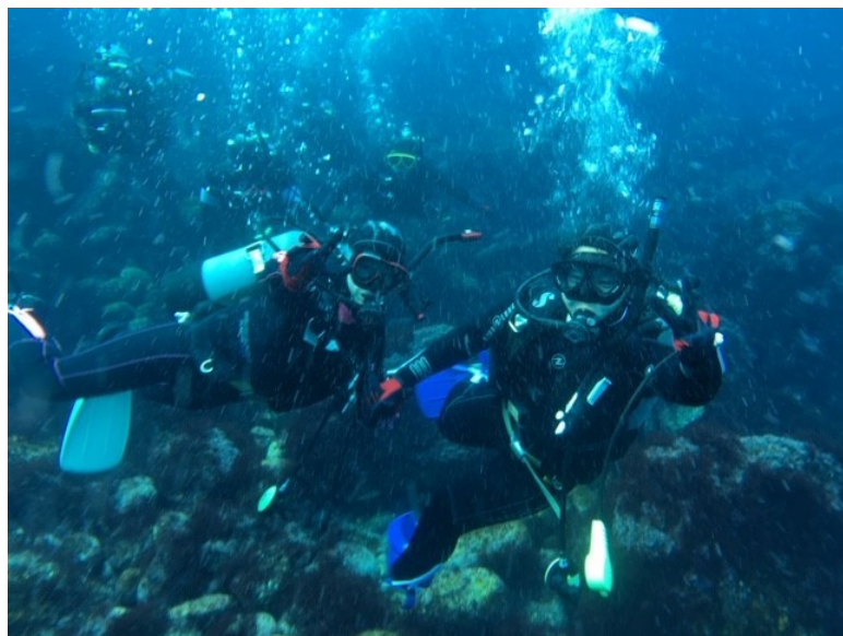
水温17℃でしたが、海中のキレイでした。