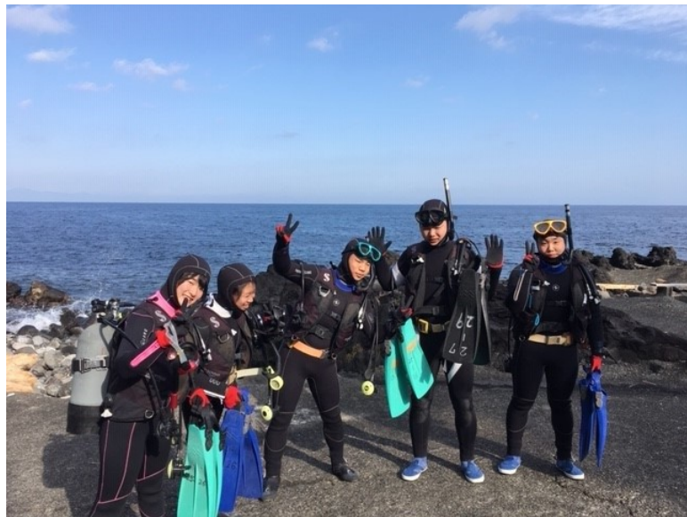
久しぶりのダイビングです！

本日は2年生のみを連れて、秋の浜へ行ってきました。イワシの大群がいるということで部員全員楽しみにして潜りましたが、やや深いところを泳いでいたとことで見ることができませんでした。しかしながら、透明度のある海で潜ることができ、部員も満足している様子でした。