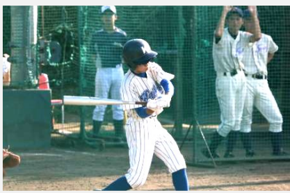
〔過去の大会の写真〕

こちらをご覧いただくと「厳しくないか!？」と感じる人もいると思います。しかし、そうした厳しさがあっても、部員たちは必死なつてついて来てくれています。そうした部員たちの姿を見て、私は彼らが本気で高校野球に打ち込んでいるのだと実感します。私たちと一緒に、本気で高校野球に打ち込んでみませんか？