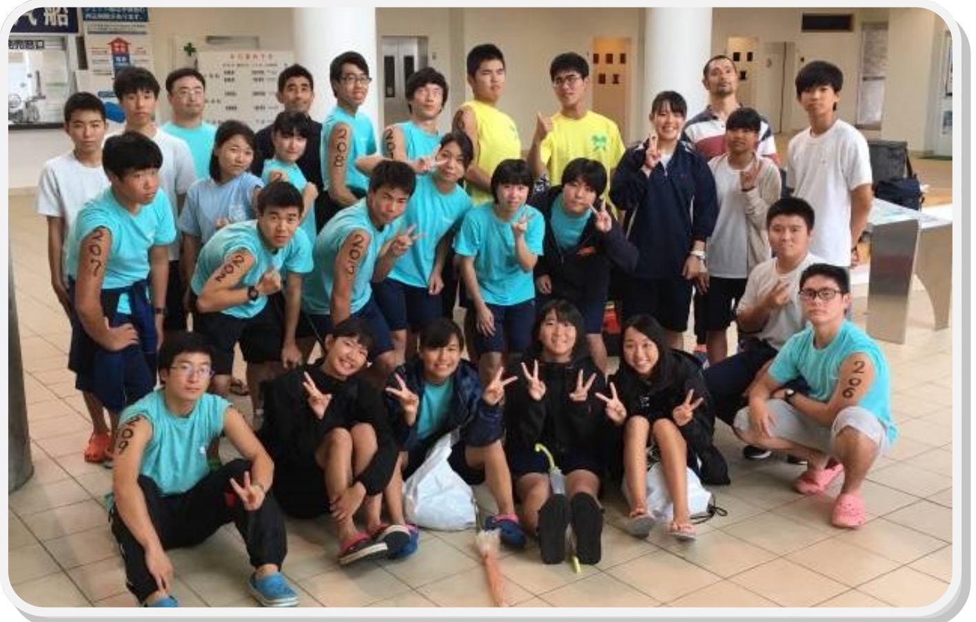
あたたかい御支援、ありがとうございました！