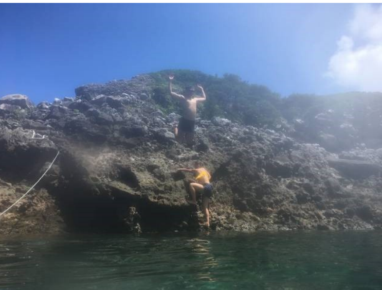
副部長の飛び込み！