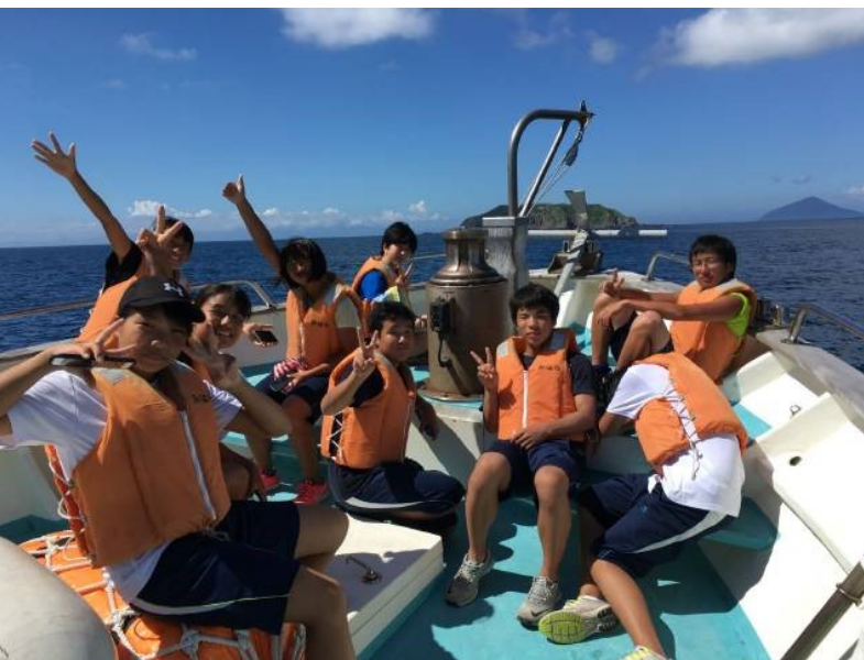
実習船「みはら」に全員乗船して式根を目指します！

《2018/07/31 合宿8日目》 台風12号の影響もなくなり、本日は式根島へ遠征です！昨年のリベンジです。