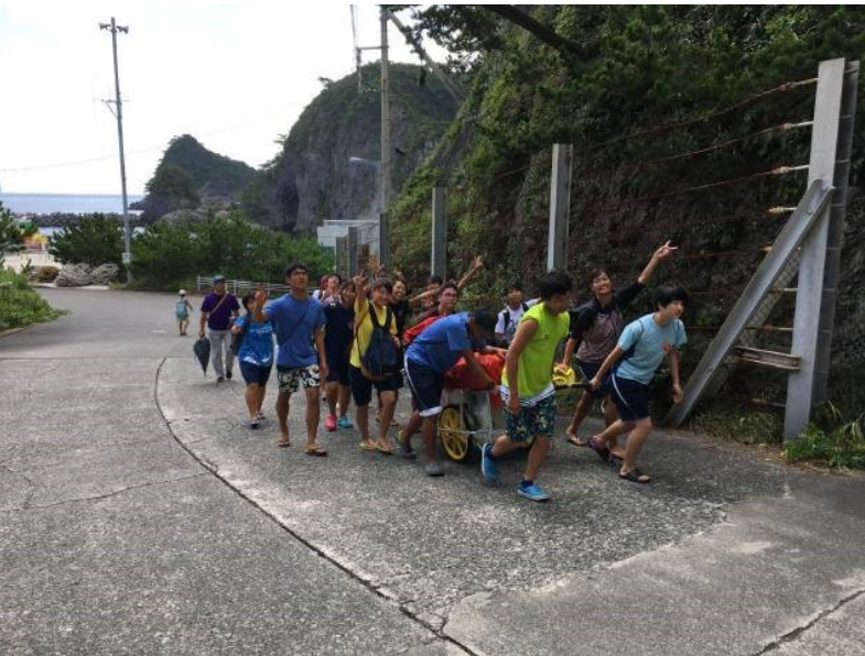
到着後は、みんなでリヤカーに荷物を載せて、移動！