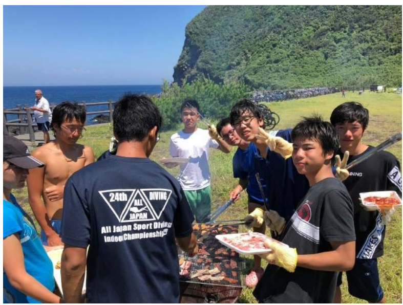
《2018/08/01 合宿9日目》 本日は、1年生を連れて野田浜にてBBQです。