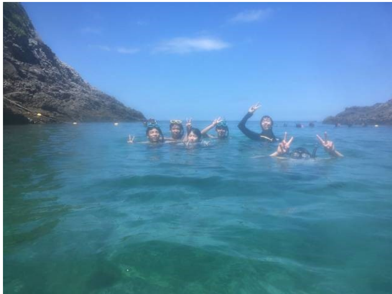
今年度入部した1年生達！