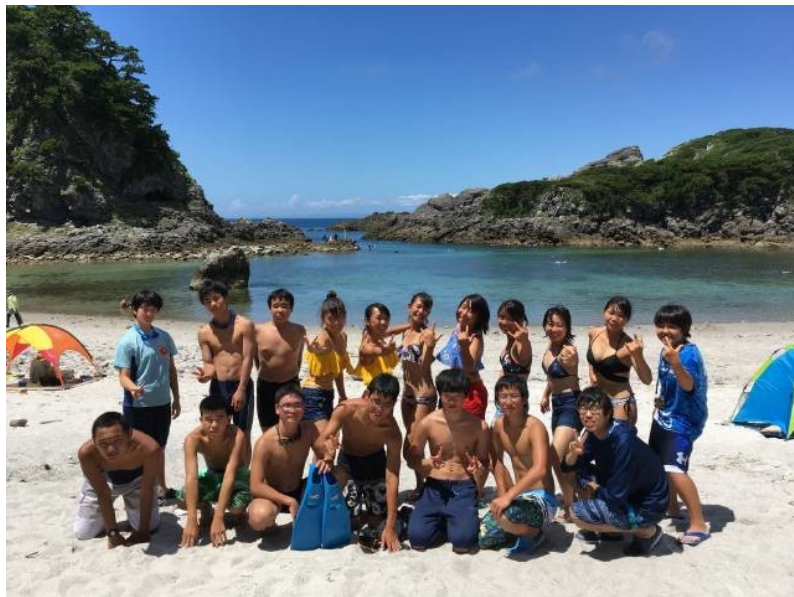
今年は式根島に来て良かったです！