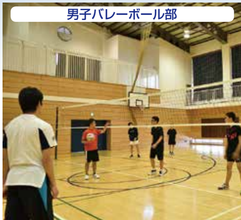
男子バレーボール部