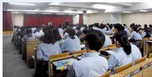
進路ガイダンスの様子