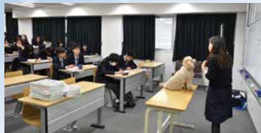
分野別進路ガイダンス 職業体験

本校独自の「進路の手引き」「進路ノート」を全学年で活用し、3年間を通じて自分の進路を考えることができますようにします。