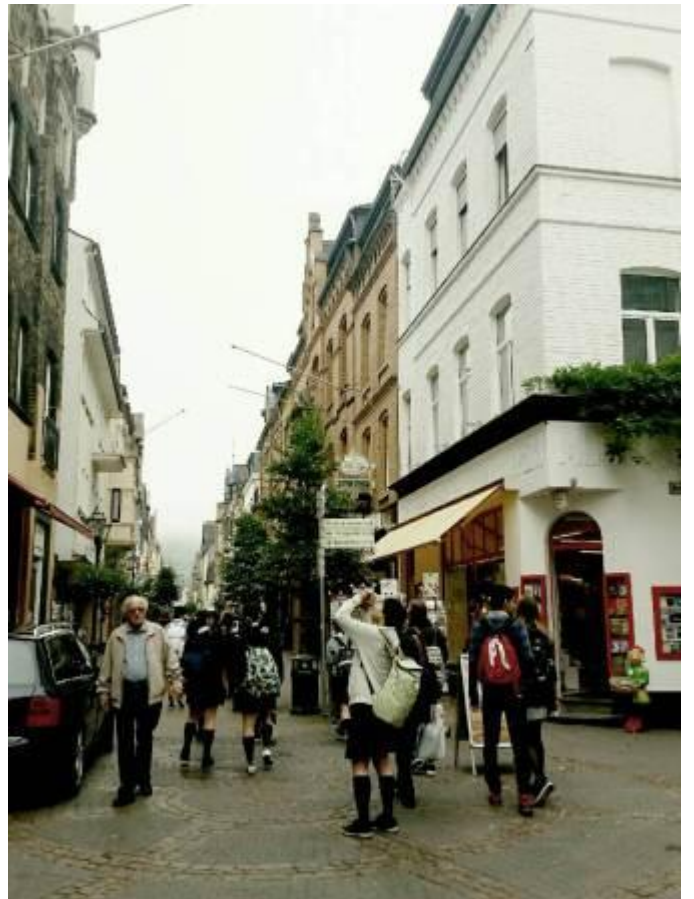
ボッパルト市内の様子