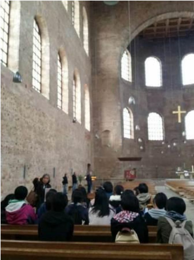
世界遺産の礼拝堂にて