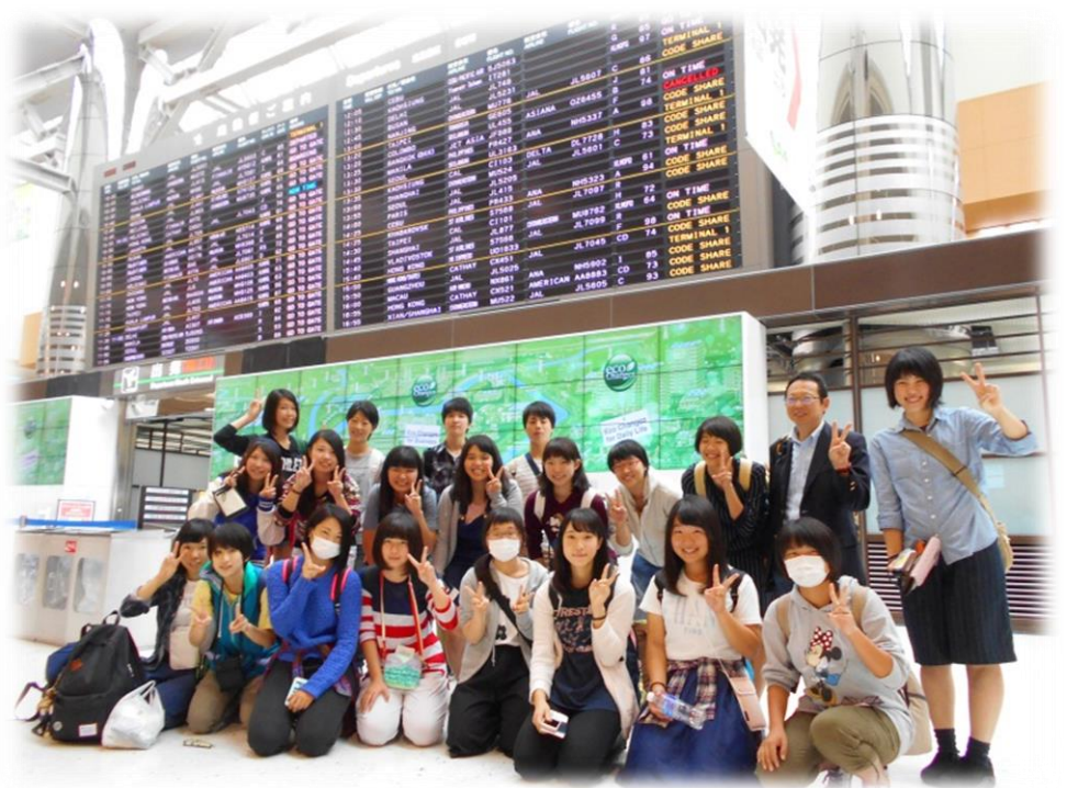
出発前の成田空港にて

生徒 19 名無事に行ってくることができました。ホームステイというかけがえのない経験をしました。海外で不慣れな英語でしたが、とても温かく迎えてもらい、いろんな方に親切にいただきました。忘れられない思い出となりました。ありがとうございました。