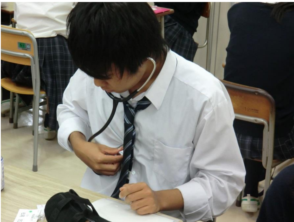
心臓の拍動を聞く