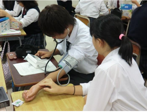
血圧の変化を知る