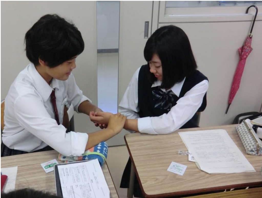
循環器ミニ体験実習 脈拍の測定