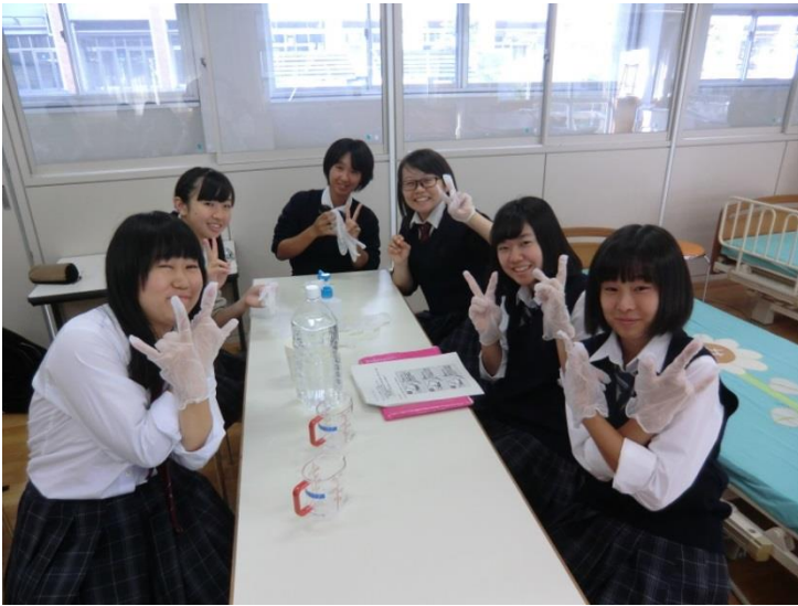
リンパ系 正しい手洗い・手袋の脱ぎ方 うがいの仕方の体験