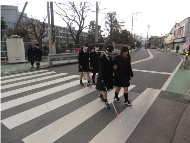
ブラインドウォーク