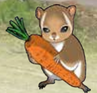
むささびが 本校のマスコットです。