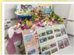
生命自然系列制作物