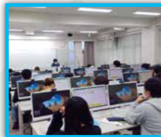
コンピュータールーム