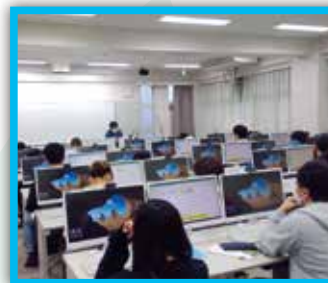
コンピュータールーム