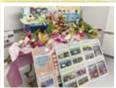
生命自然系列制作物