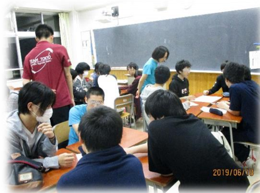
(2年次進路ガイダンス)