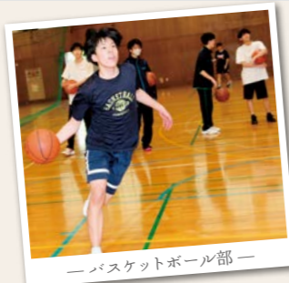
—バスケットボール部—