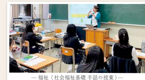
— 福祉(社会福祉基礎 手話の授業) —