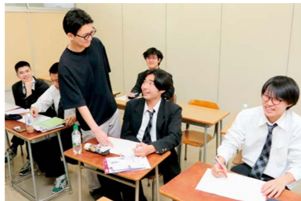
— 数学Ⅲ —

英語力はどの進路先でも必要とされるため、1年次から3年次まで習熟度別の少人数制授業を実施し、生徒一人ひとりの学力に合わせた授業を行っています。さらに1年次での数学も習熟度別授業を取り入れています。選択科目が多い大泉桜ですが、英語と国語は3年間を通して全生徒が学習します。