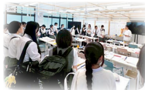
— 上級学校訪問 —