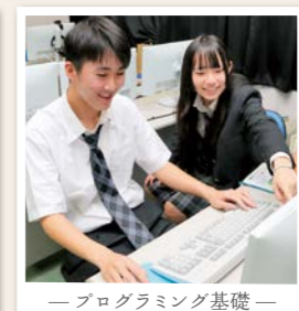
— プログラミング基礎 —