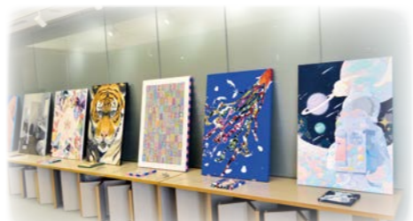
— 卒業制作展（ゆめりあホール） —