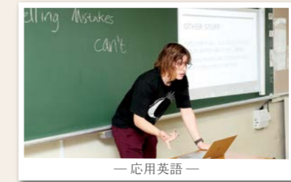
— 応用英語 —

単位制の魅力は、自分に合った授業を選べること。苦手を克服したり、興味のある分野を深めたり、進路に必要な学びにしっかり取り組めます。時間割を自分で組み立てることで、主体的に学ぶ力も養われます。 文系・理系の大学受験対策はもちろん、美術系、看護・福祉、ファッション、調理、ビジネス、プログラミングなど、進学・就職の両面に対応した多彩な講座を用意しています。