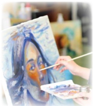
— 絵画 —