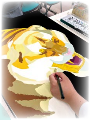
— ビジュアルデザイン —