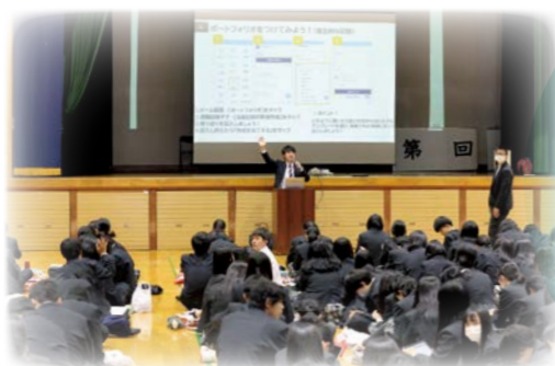
— 進路講演会 —