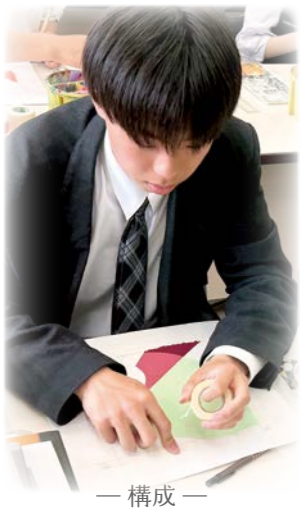
— 構成 —

美術を多く学びたい生徒は1年次から「美術Ⅰ」と「素描」を学びます。 2年次より美術系進路を希望する生徒は、「絵画」または「デザイン」など学びの方向性を意識した時間割を決定します。 3年次では学びの集大成となる「卒業制作」をおこないます。 美術系進路を希望しない生徒でも美術Ⅱ・Ⅲが選べるようになっています。