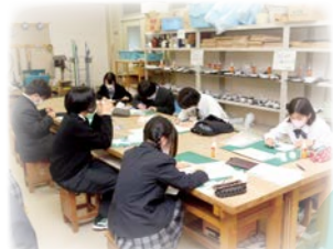
— クラフト —