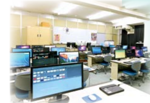
— メディアアート —