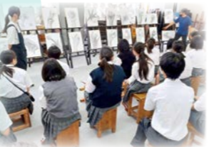
— 講習会 —

大泉桜には同じ目標を持つ生徒が多くいます。3年間様々な生徒作品を見て刺激を受け、切磋琢磨することで感性と表現力を磨きます。また、多くの先輩たちの作品や受験対策資料を進路指導に活用しています。