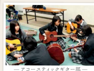
—アコースティックギター部—