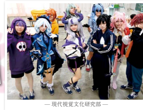
—現代視覚文化研究部—