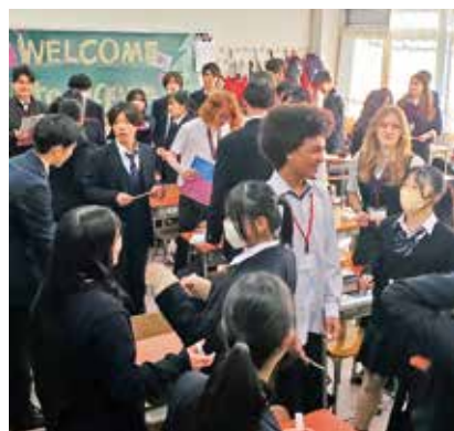
東京グローバルフレンドシッププログラム