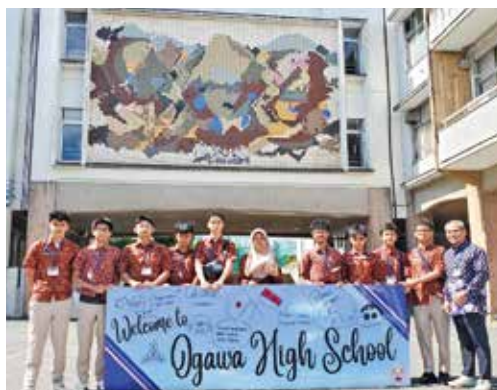
インドネシア SMA Labschool Cirendeu校 来校