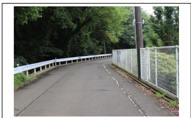
この道を進みます。