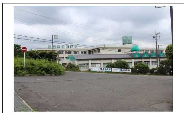
写真に見える校舎が都立野津田高等学校です。