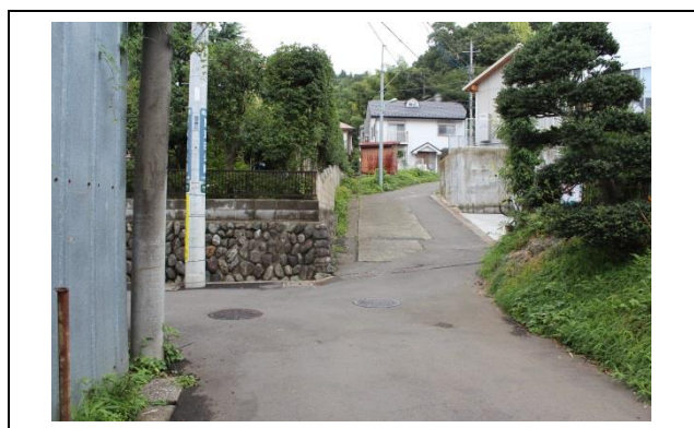
道なりに右に曲がると、写真の岐路があります。写真の右の道を進んでください。