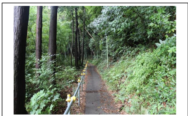
登っていくと森に入っていきますが、さらに登ってください。