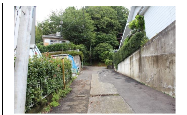
坂道を登っていきます。