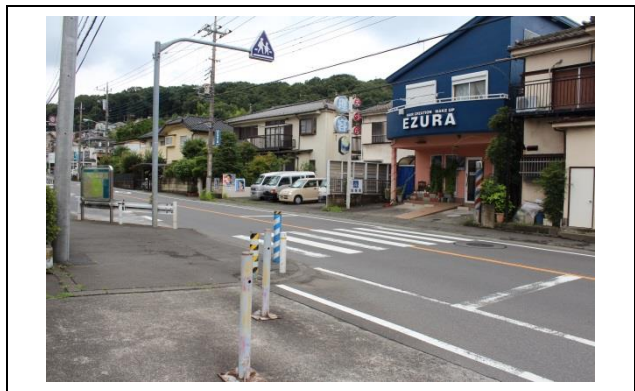
神奈中サービスセンターを出てすぐ左に見える横断歩道を渡ります。