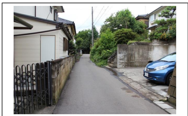
左折したらこの道を進みます。