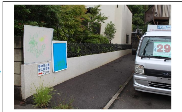
横断歩道を渡り左に進むと、写真の道があります。細い道ですが、進んでください。