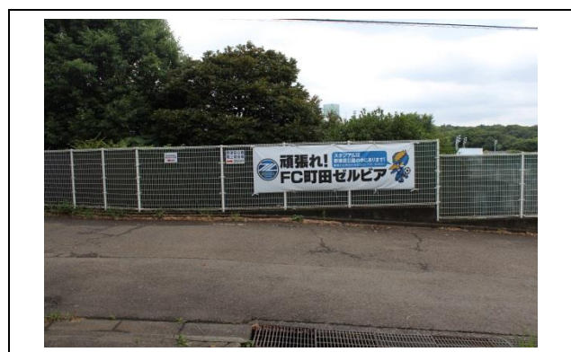
登り切ったら、突き当りを左に進んでください。