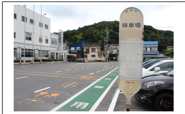
最終停留所「野津田車庫」