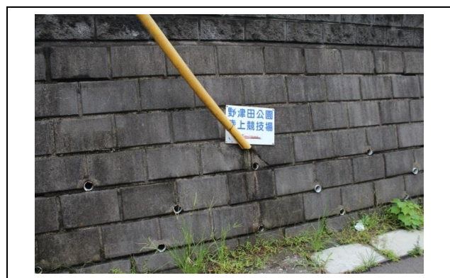
突き当りに「野津田公園陸上競技場」の標識があります。そこを左に進んでください。