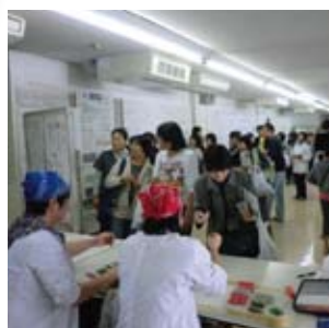
農高祭（食品化学科生産品販売）