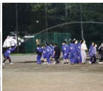
スポーツフェスティバル