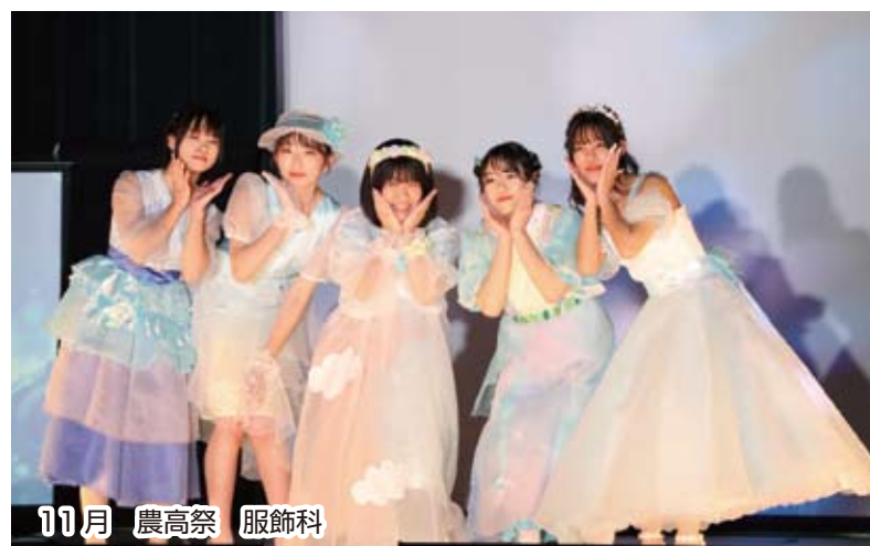
11月 農高祭 服飾科