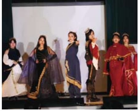
ファッションショー