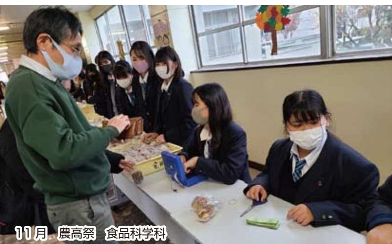
11月 農高祭 食品科学科