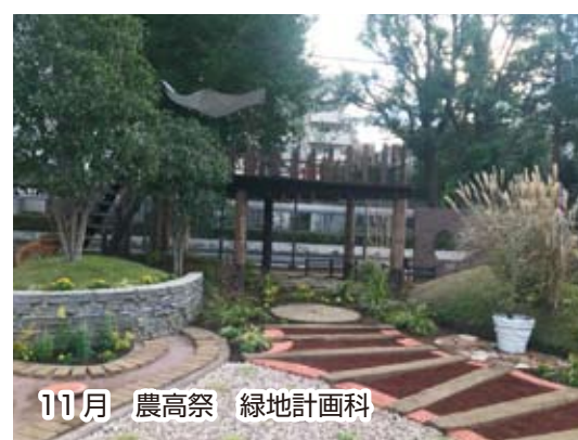
11月 農高祭 緑地計画科