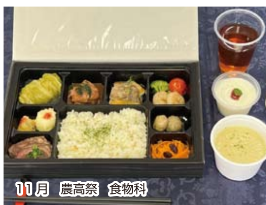
11月 農高祭 食物科