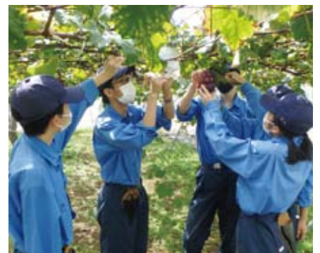
果樹 ブドウの収穫