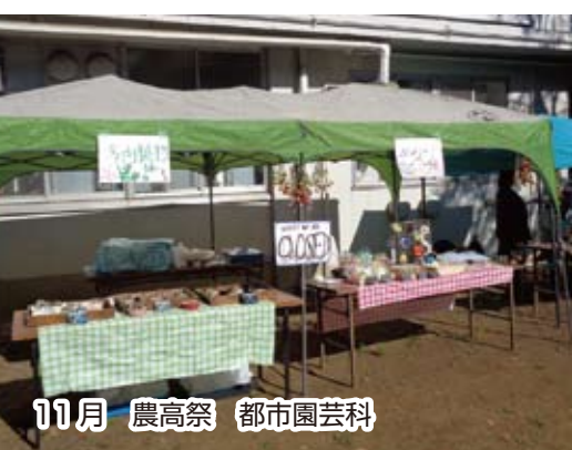
11月 農高祭 都市園芸科