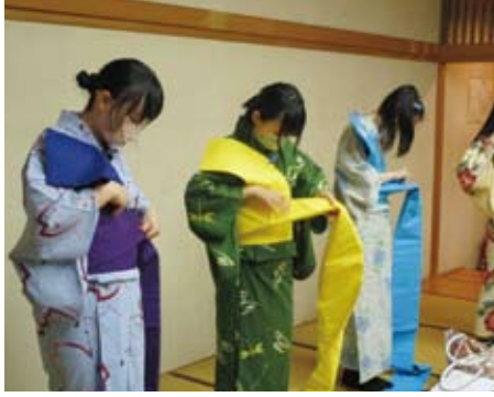
浴衣・帯製作、着付け