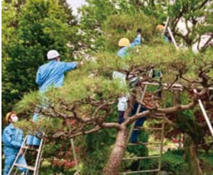
造園技術：樹木の管理