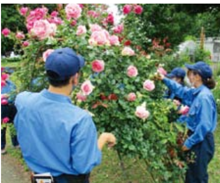
草花 バラの花から摘み