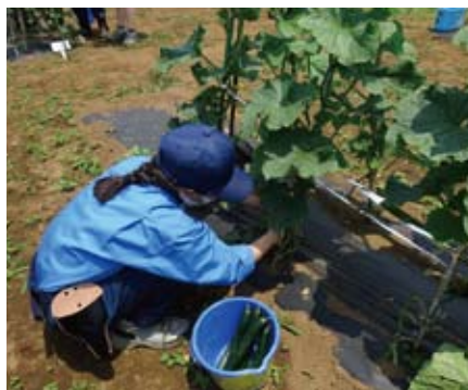
野菜 キュウリの誘引と収穫