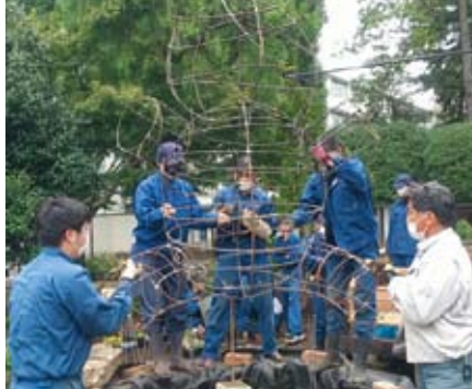
課題研究：庭園制作